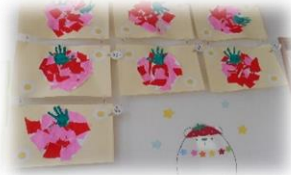
イチゴも作りましたー！