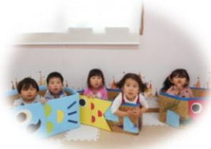
こいのぼりの製作もがんばりました！

あっという間に春が過ぎ去り、季節は梅雨に移り変わりました。5月には3回目の緊急事態宣言の発令の為、大好きな公園で遊ぶことができず、思いっきり遊びたくてウズウズしている子ども達ですが、子ども達はどんな時も明るく保育室は毎日笑い声いっぱいです♡ コロナ禍の中、体調管理に気を付けながら楽しんで過ごしていきたいと思います。