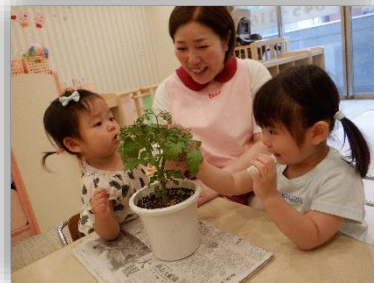
あかちゃんトマト🍅