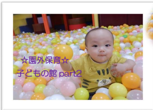
☆園外保育☆ 子どもの館 part2