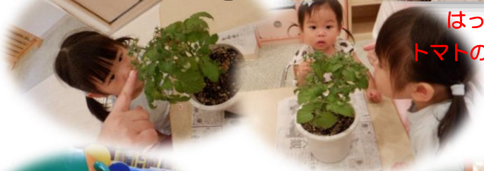
はっぱも トマトのにおい♡