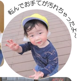
転んでお手てが汚れちゃったよ