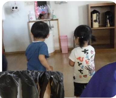
おばけをやっつけろ！